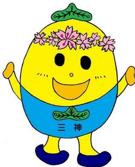
三神小イメージキャラクター 「みかみん」